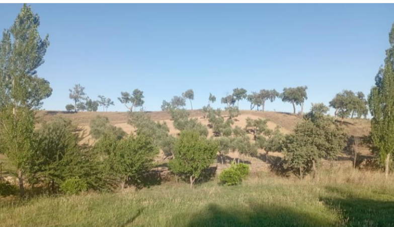
Finca de 4,3 ha de olivar y bosque mediterráneo con pinos.